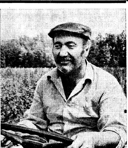
2 июня «Труд» — ТАСС

На снимке: во время беседы.